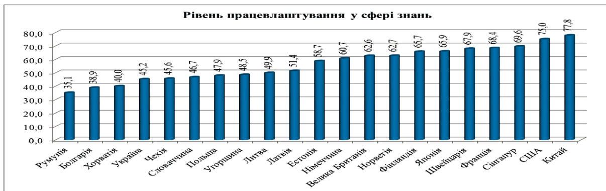
Рисунок 2 – Рейтинг розвинених країн світу та України за значеннями рівня працевлаштування у сфері знань у 2022 році (шкала від 0 до 100)

Стосовно такого показника, як рівень працевлаштування у сфері знань (рис. 2), у 2022 році Україна зі значенням 45,2 займала дещо вищі позиції порівняно із Румунією (35,1), Болгарією (38,9), Хорватією (40,0) та дещо нижчі відносно Чехії (45,6), Словаччини (46,7), Польщі (47,9), а також значно нижчі у порівнянні з Китаєм (77,8), США (75,0), Сингапуром (69,6), Францією (68,4), Швейцарією (67,9), Японією (65,9).