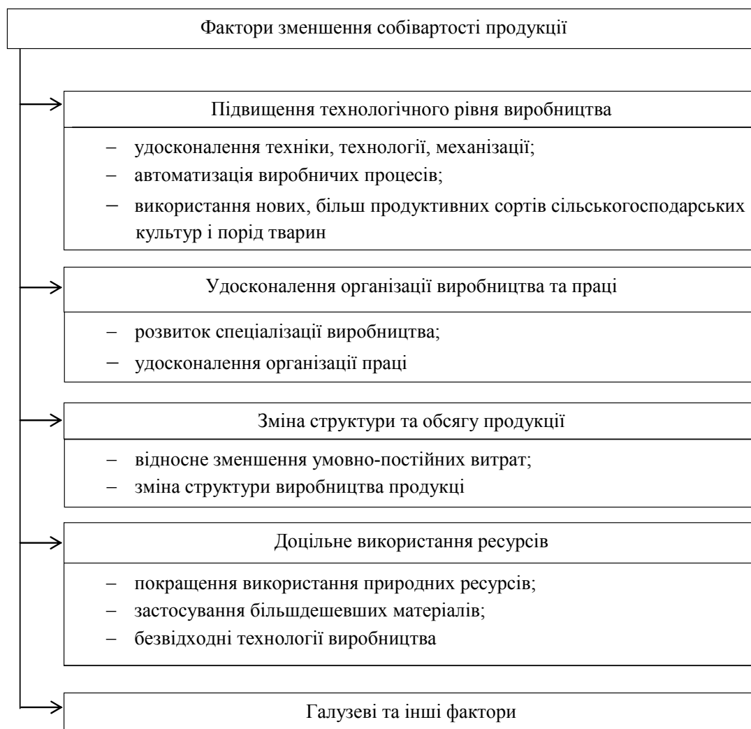
Рисунок 2 – Фактори зменшення собівартості продукції