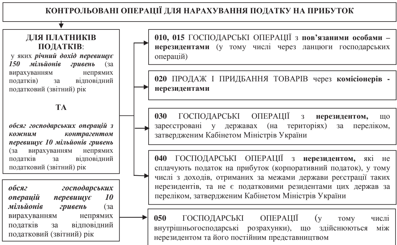
Рисунок 1 – Види контрольованих операцій для нарахування податку на прибуток

У Податковому кодексі України (ст. 14.1.159) чітко визначені критерії пов'язаних осіб для контрольованих операцій, що схематично представлено на рис. 2.