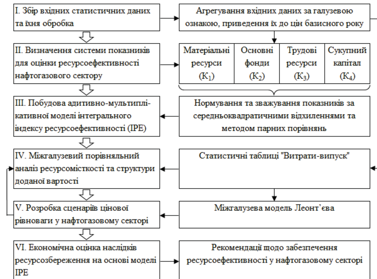
Рисунок 2 – Методичний підхід щодо ефективного розвитку ресурсозбереження в нафтогазовому секторі України

З урахуванням вказаних причинно-наслідкових зв'язків, розроблений методичний підхід щодо ефективного розвитку ресурсозбереження в нафтогазовому секторі України, зміст якого наведений на рис. 2. Розглянемо його складові більш детально.